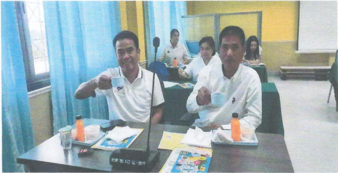
พ่อ (ครอบครัวสนิท ลอเรน) นักทรัพยากรบุคคล